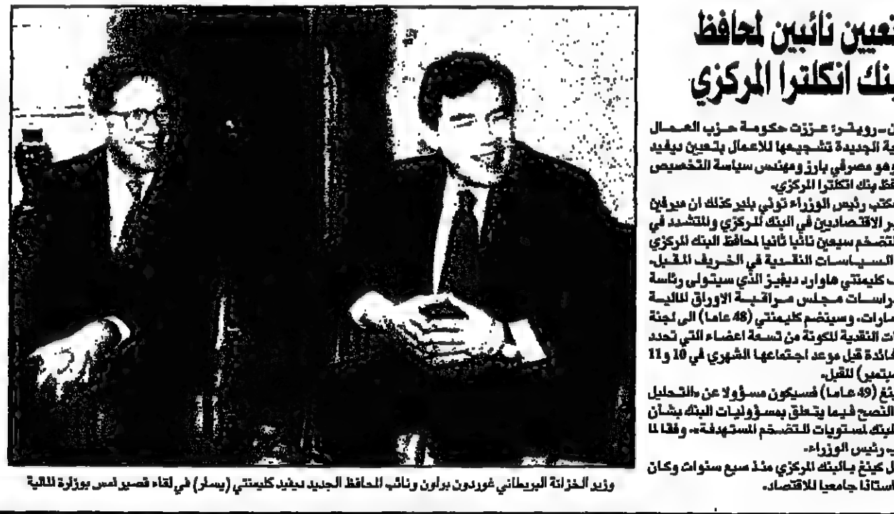
وزير الخزانة البريطاني غوردون براون ونائب المحافظ الجديد جيريد كيميتي (يسار) في لقاء قصير مع وزيرة المالية...